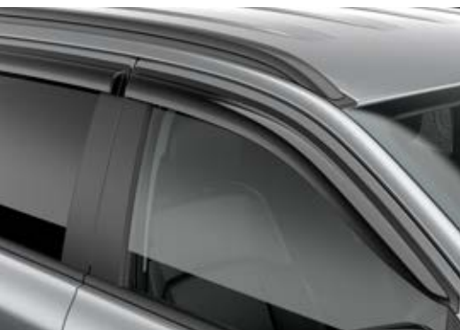
Vè che mưa- 1 set 4 chiếc