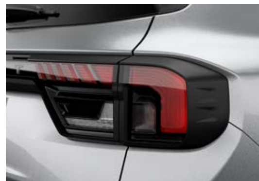
Ốp viền trang trí đèn pha