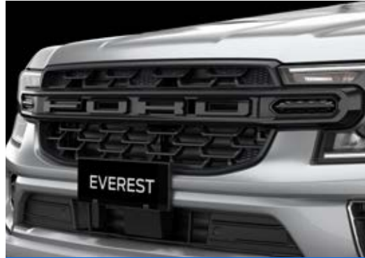
Mặt ca lăng chữ Ford