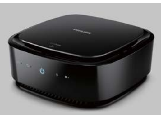
Máy lọc không khí trên xe ô tô