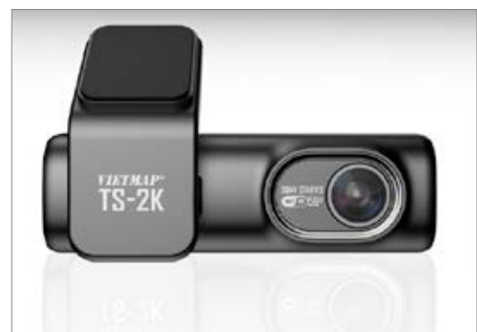
Camera hành trình Vietmap TS-2K