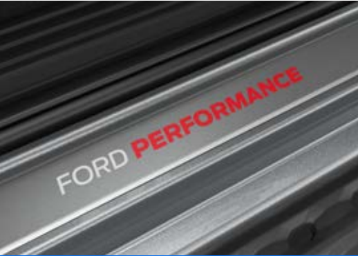
Ốp bạc cửa