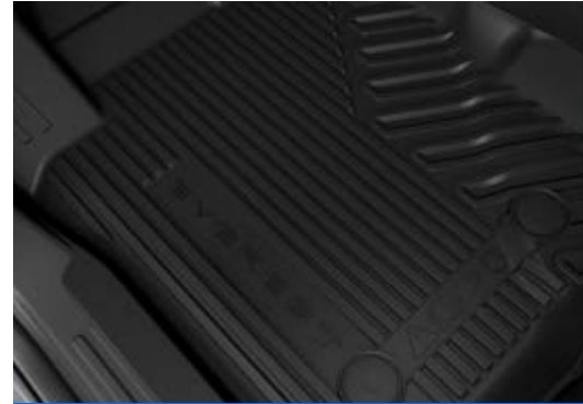
Thảm lót sàn cao su