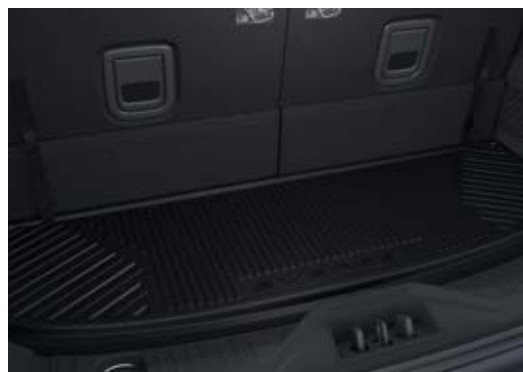
Thảm lót cốp xe-Cargo Mat - Large (7 Seater)