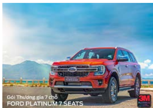
Gói Thương gia 7 chỗ FORD PLATINUM 7 SEATS